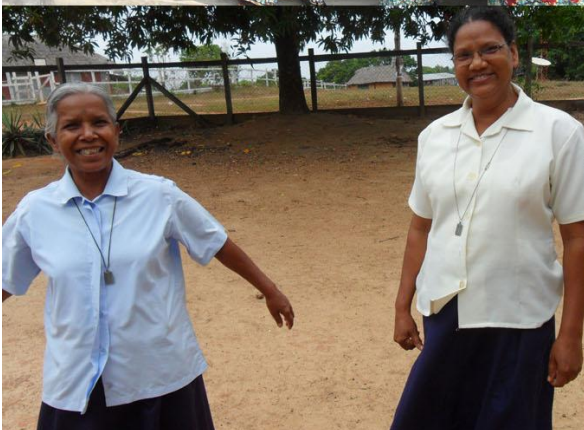
Zrs. Bernardine en Anima in Guyana