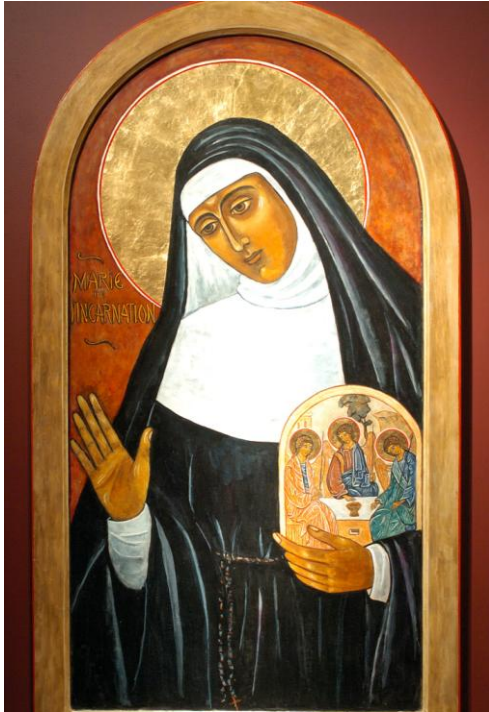
Saint Marie of the Incarnation

immigranten uit Europa. " Zo veel in ons land kreeg vorm door hen met een Godgewijd leven" zegde hij. " Hun getuigenis, hun leven en dienstbaarheid kregen vorm door dat heilig leven".